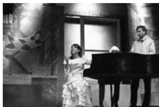
Stanno suonando la nostra canzone