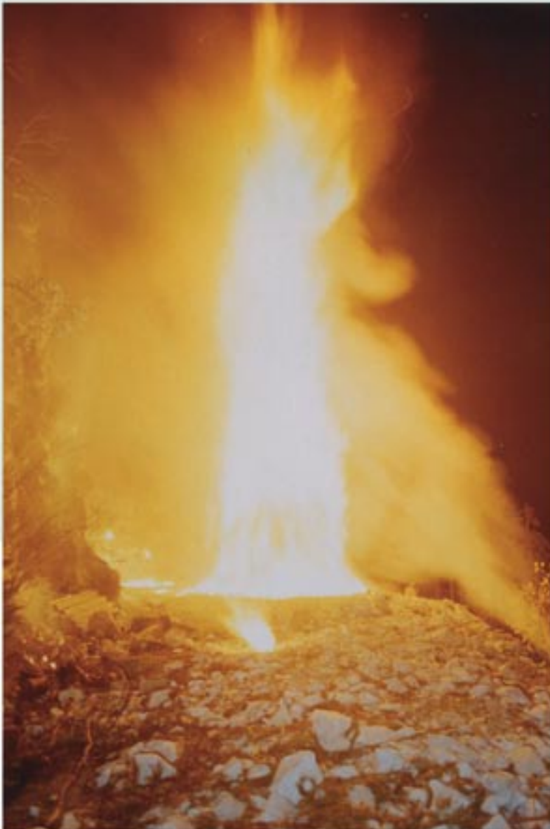
Uno spettacolare fuoco di S. Martino