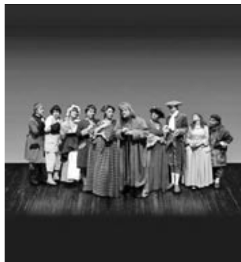
Sior Todero brontolon