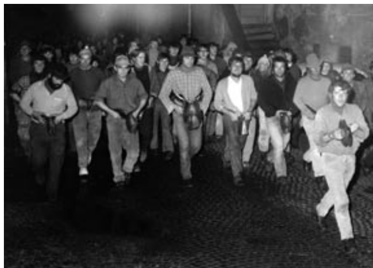
Un'immagine della festa nel 1971

Questi festeggiamenti del San Martino d'altri tempi, usanze più modeste e discrete ma comunque di-