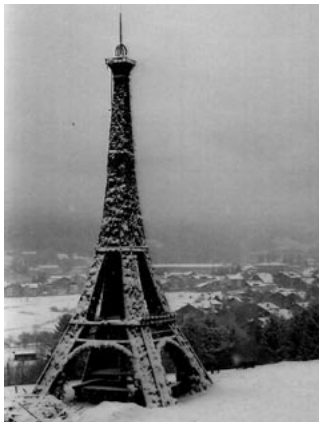
La torre Eiffel dei "Paneti" a Löze nel 2004